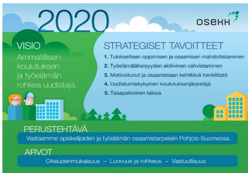
Kuva 1. Osekk strategia 2020.

Koulutuskuntayhtymän yhteiset arvot, oikeudenmukaisuus ja vastuullisuus antavat toiminnallemme raamit, joiden mukaan toimimme avoimesti, läpinäkyvästi ja ennalta sovittujen periaatteiden mukaisesti perustehtävän toteuttamisessa, kaikessa yhteistyössä ja johtamisessa. Toimintamme keskiössä ovat luovuus ja rohkeus. Toimimme innovatiivisesti sekä ennakkoluulottomasti uusia avauksia tehden opiskelijoidemme ja asiakkaidemme sekä työyhteisömme parhaaksi. 3 OSAOn keskeisin toiminta kuvataan toimintajärjestelmässä.