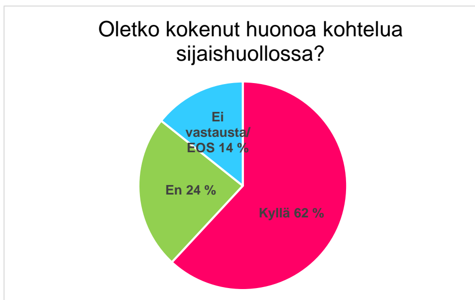
Kuvio 5: Oletko kokenut huonoa kohtelua sijaishuollossa?

Sijaishuollon laadussa on kyselyn perusteella vielä kehittämisen varaa. 62 prosenttia nuorista oli kokenut huonoa kohtelua sijaishuollossa ollessaan.