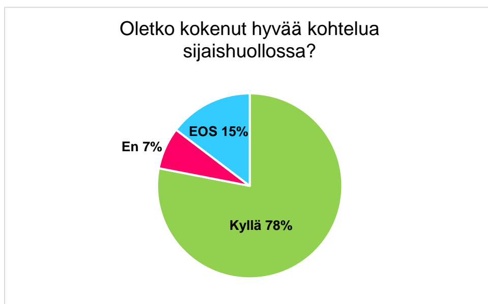
Kuvio 4: Oletko kokenut hyvää kohtelua sijaishuollossa?

Suurin osa nuorista oli kokenut sekä hyvää että huonoa kohtelua sijaishuollossa ollessaan. Tämä on ymmärrettävää, sillä vastausten perusteella huonoa sijaishuoltoa saattoi laitoksessa edustaa nuorelle epämieluisa ohjaaja, ja hyvää taas mukava ohjaaja. Ne nuoret, jotka olivat asuneet useissa eri yksiköissä, vertailivat myös sijaishuoltopaikkoja keskenään.