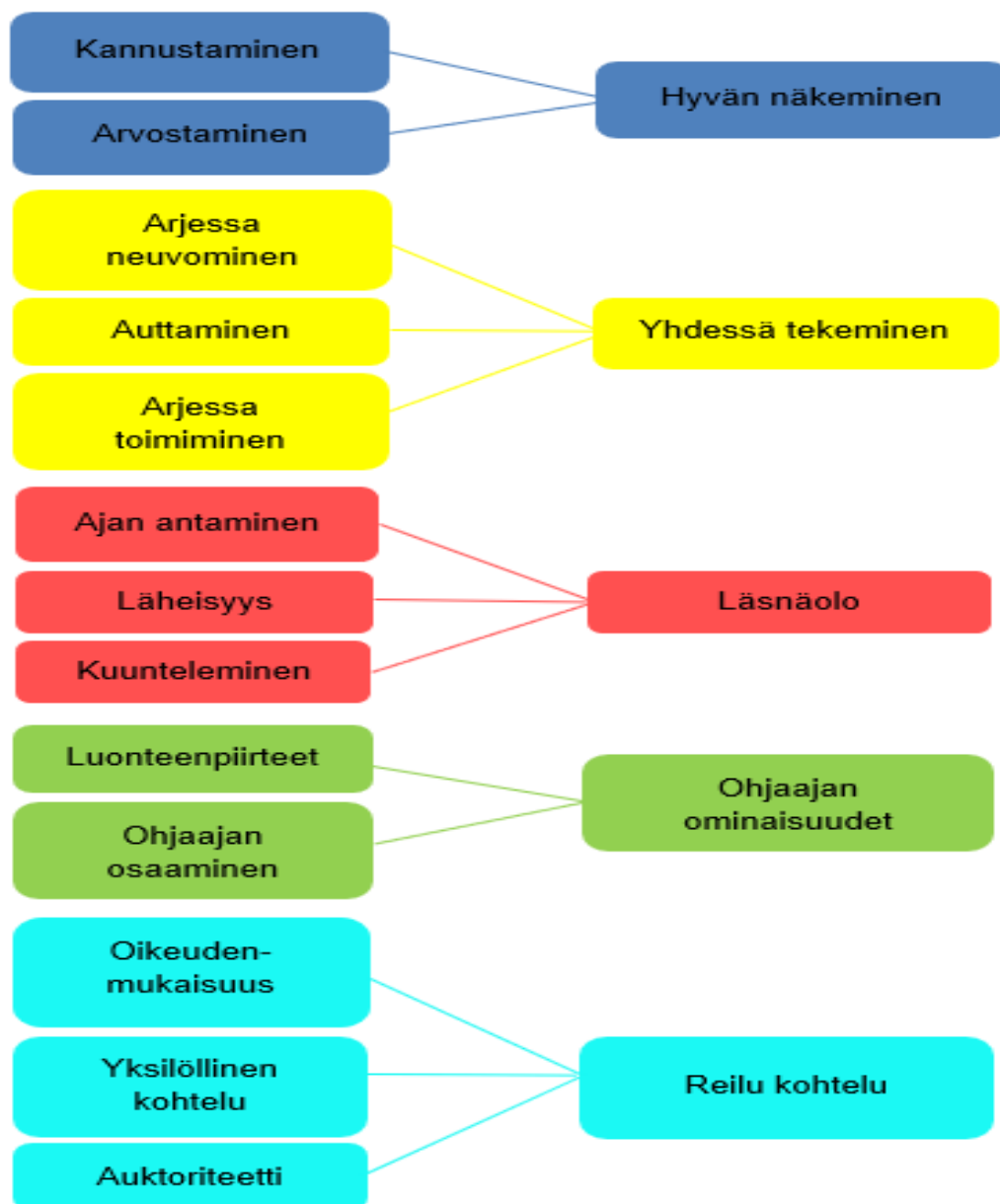
Kuvio 2 Aineiston analyysin eteneminen

Analyysin yläluokiksi muodostuivat hyvän näkeminen , yhdessä tekeminen , läsnäolo , ohjaajan ominaisuudet ja reilu kohtelu . Yläluokka hyvän näkeminen muodostui alaluokista kannustaminen ja arvostaminen. Toinen yläluokka yhdessä tekeminen muodostui alaluokista arjessa neuvominen, auttaminen ja arjessa toimiminen.