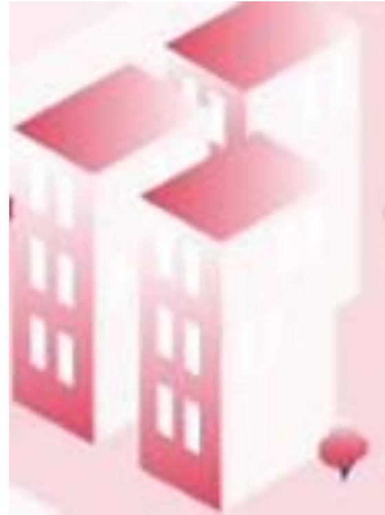
Oppilaitos 1: Autoala Hiusala