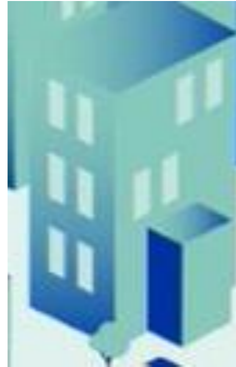
Oppilaitos 2: Ravintola-ala Logistiikka