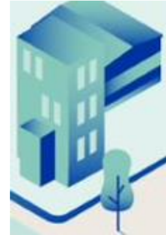
Oppilaitos 3: Rakennusala Sosiaali- ja terv.ala