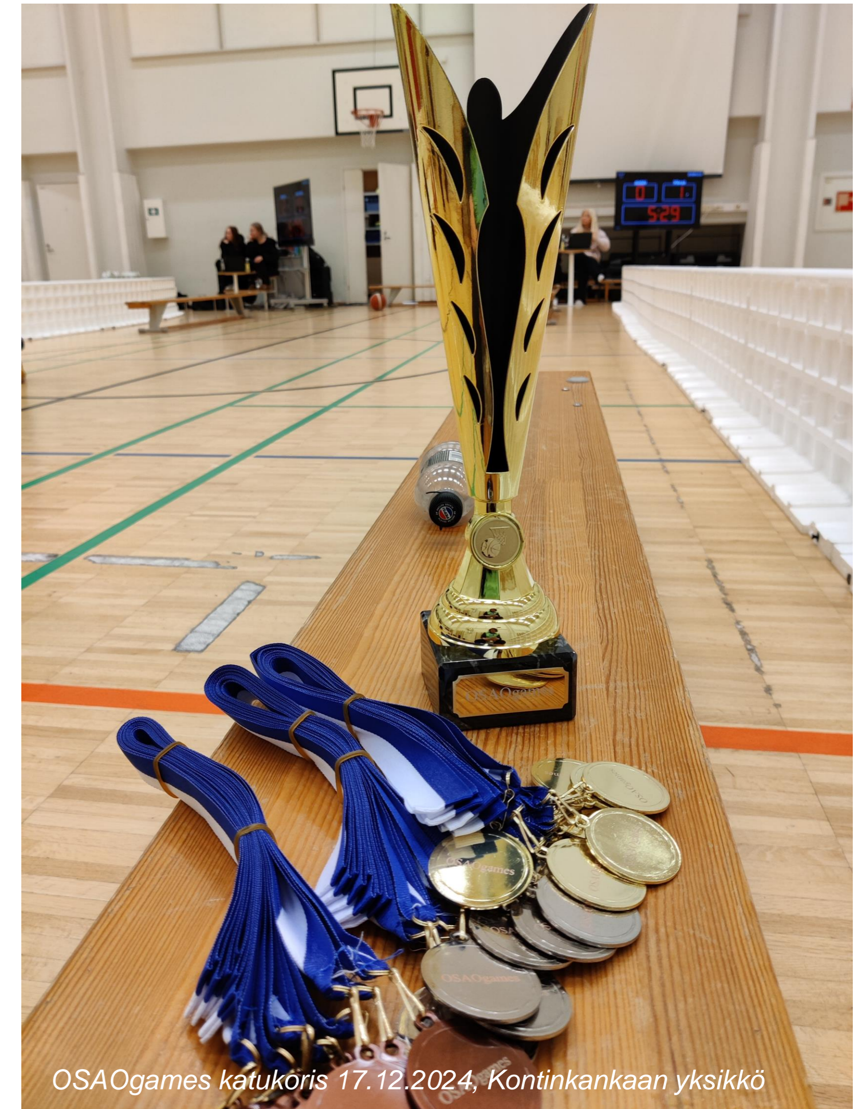
OSAOGames katukoris 17.12.2024, Kontinkankaan yksikkö